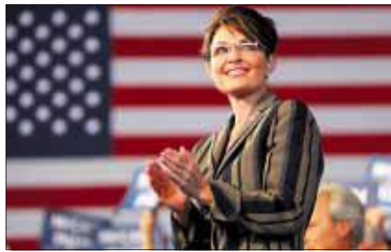
PALIN: Den Pliktoppfyllende Datter?