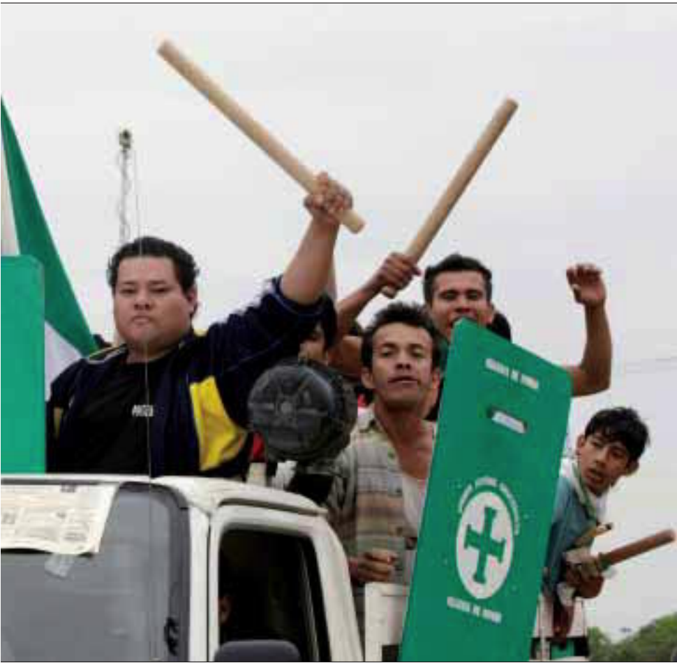
Jonen i provinsene Santa Cruz, Beni, Pando, Tarija og Chuquisaca oppfordret til generalstreik.