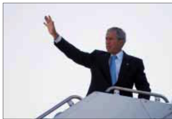
SNART PÅ FILM: George W. Bush vinker.

Maktskiftet i USA er et faktum før valget.