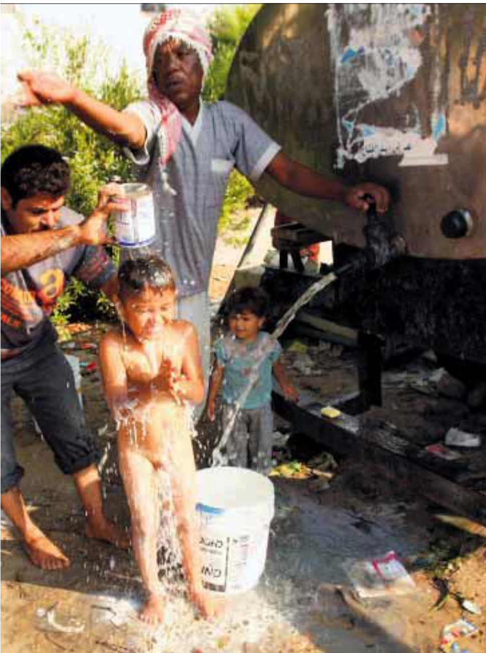
israelske soldater på tross av våpenhvilen. Ved Rafah venter folk på å få krysse grensa til Egypt.

Shawish, som jobbet ved Det islamske universitetet før han ble syk, må til avhør.