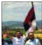
Serbere i Kosovo

Utenriksminister Sergej Lavrov og resten av den russiske ledelsen kan ikke se for seg at Abkhasia og Sør-Ossetia vil vende tilbake til Georgia. President Dmitrij Medvedev advarer om at Kreml vil svare på nye georgiske angrep med samme mynt. Moskva har derimot ikke svart på Abkhasias og Sør-Ossetias bønn om anerkjennelse. Sammenlikningen med Kosovo har ligget i dagen siden USA før forhandlingene mel-