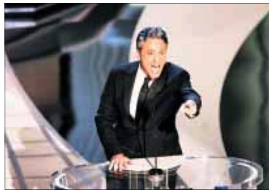
TIL Å STOLE PÅ: Er Jon Stewart med sitt Daily Show USAs mest pålitelige nyhetskilde?

Kosovo har bedt FN starte sin tilbaketrekking.