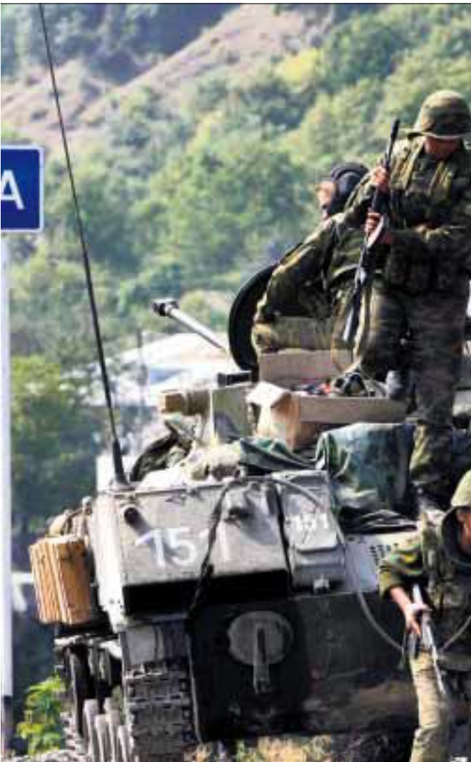
opkommandoen, general John Craddock til pressen om Russlands tilbake-